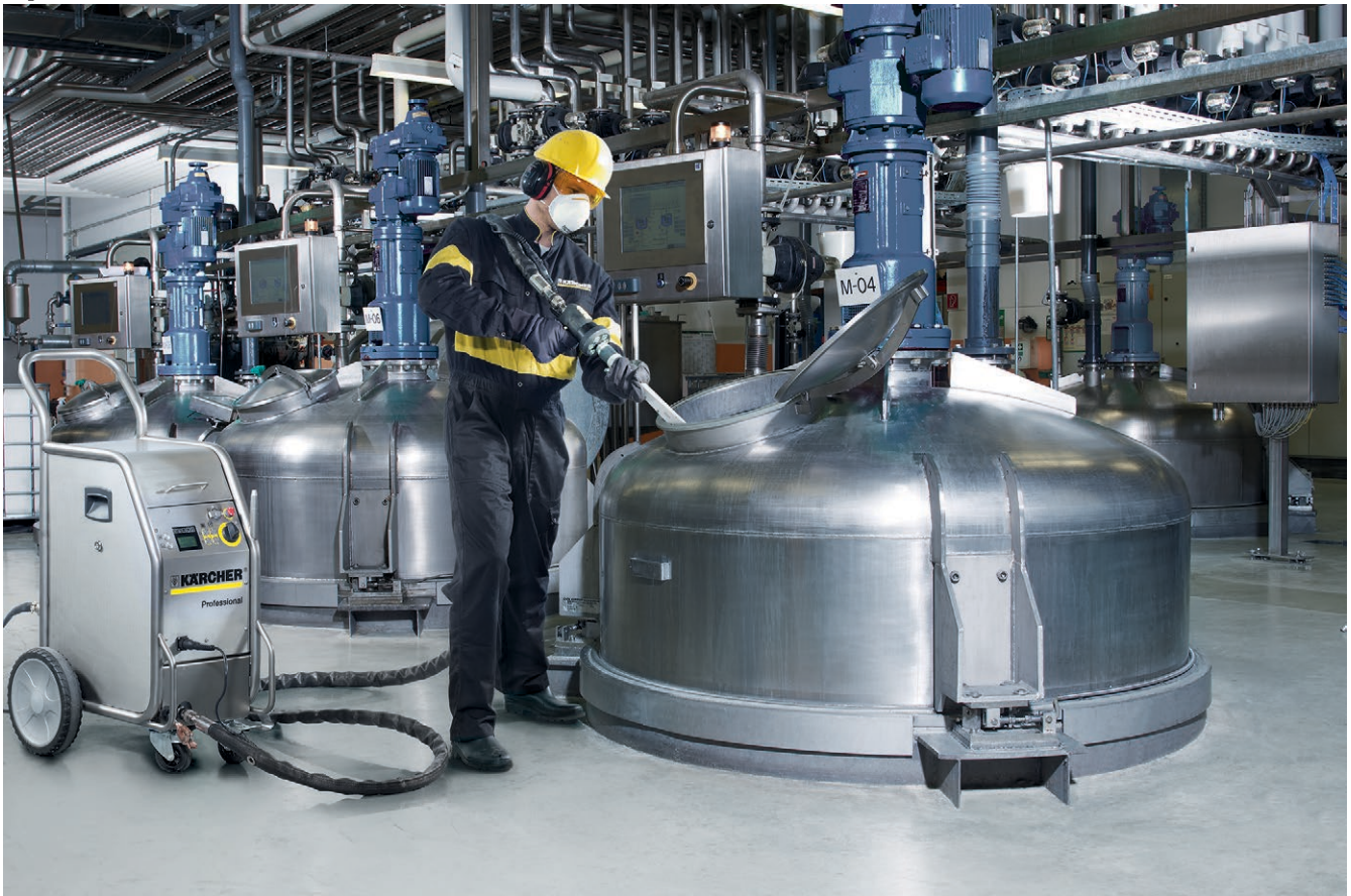
IB 7/40 Advanced